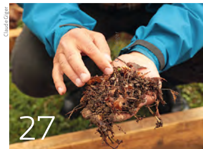
Ökologische und resiliente Landwirtschaft ist möglich.