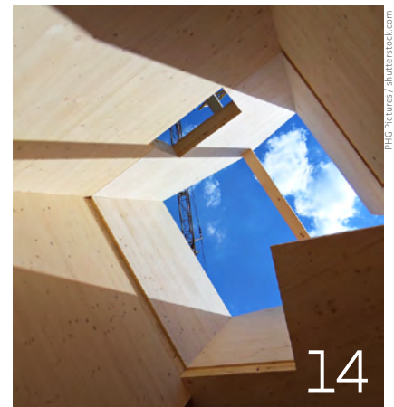
Neues altes Bauen mit nachhaltigen Materialien in Basel